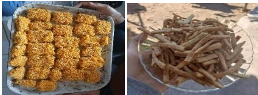
Gambar 6. Produk Nugget dan Stik Ikan Hasil Pengolahan