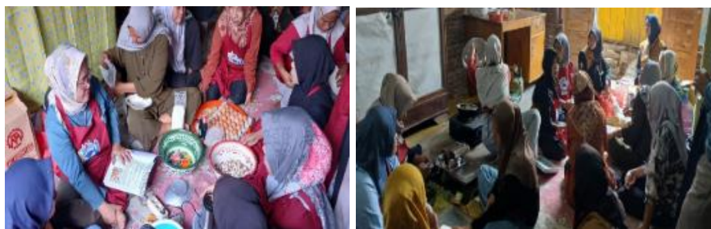
Gambar 4. Pelatihan Pembuatan Nugget dan Stik Ikan

Pada kegiatan pelatihan tim pengabdian masyarakat mendampingi pelaksanaan kegiatan dari awal sampai akhir. Selama kegiatan berlangsung, istri nelayan mengikuti kegiatan secara aktif. Hal ini dibuktikan dari kerja sama antar anggota kelompok, istri nelayan juga aktif dalam mengungkapkan pengalaman, presepsinya pada saat memasak dan mengikuti kegiatan sampai akhir.