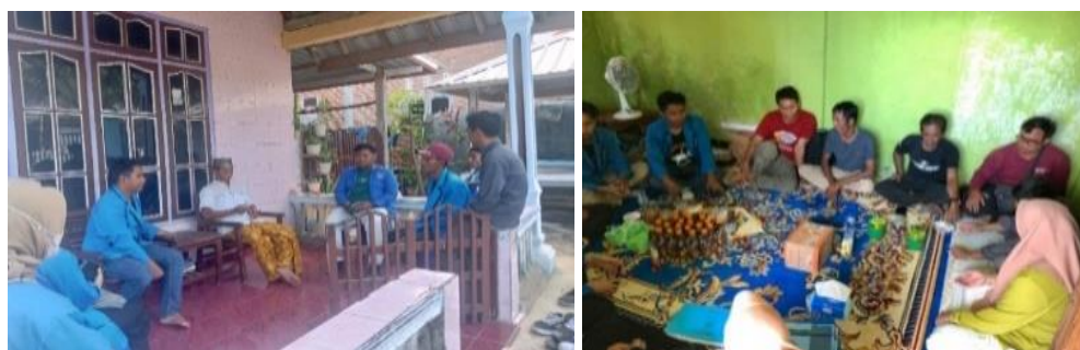
Gambar 2. Koordinasi dengan Pemerintah Desa dan Kelompok Sasaran

Pada kegiatan ini, koordinasi dilakukan dengan pemerintah Desa Labuhan Kuris dan kelompok mitra/istri nelayan (Gambar 2). Koordinasi dilakukan selama satu hari. Tujuannya untuk menjelaskan maksud dan rencana kegiatan pengabdian, pengambilan data jumlah kelompok istri nelayan yang akan berpartisipasi pada kegiatan, dan menentukan jadwal serta tempat kegiatan berlangsung dan mendengarkan harapan dari pemerintah desa, masyarakat sasaran serta menyatukan pemahaman. Koordinasi dengan pemerintah desa dan kelompok sasaran menghasilkan kesepakatan bahwa pemerintah desa dan masyarakat sasaran menyetujui kegiatan pelatihan diversifikasi hasil perikanan bagi istri nelayan dengan harapan dengan adanya pelatihan, istri nelayan dapat membantu perekonomian keluarga. Secara ringkas, hasil koordinasi dengan pemerintah desa dan kelompok sasaran disajikan pada Tabel 1.