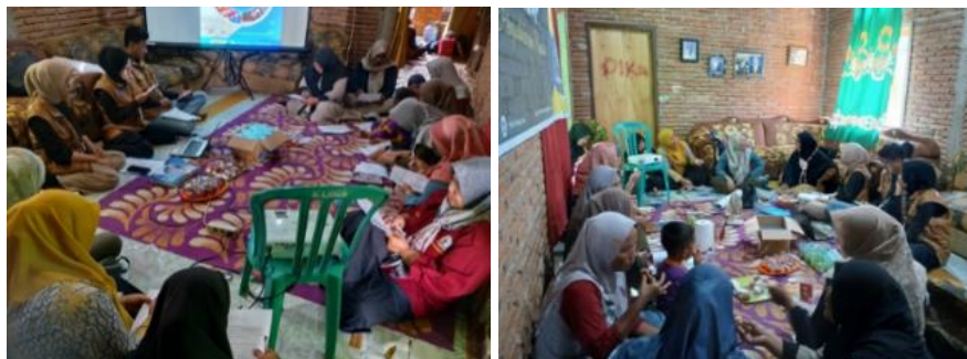
Gambar 3. Kegiatan Penyampaian Materi dan Diskusi

Kegiatan pelatihan dilakukan dengan metode ceramah (pemaparan materi menggunakan alat bantu LCD) dan praktek langsung (Gambar 3 dan 4). Sebelum diberikan materi kelompok sasaran/istri nelayan diminta untuk mengisi absensi, selanjutnya diberikan pretest. Materi yang diberikan pada kegiatan pelatihan terdiri atas enam pokok bahasan. Semua materi kegiatan ini dirangkum dalam satu modul berjudul “pelatihan diversifikasi dan pemasaran hasil perikanan. Sebagian besar materi dalam modul tersebut disertai dengan peran penting diversifikasi hasil perikanan, Pengolahan beberapa produk berbahan baku sumber daya ikan, pengemasan produk makanan, pengurusan izin usaha, pemasaran online, dan bisnis canvas. Ceramah dan diskusi dilakukan kurang lebih selama 60 menit. Kegiatan ini diikuti oleh seluruh istri nelayan yang telah disepakati sejumlah 10 (sepuluh) orang.