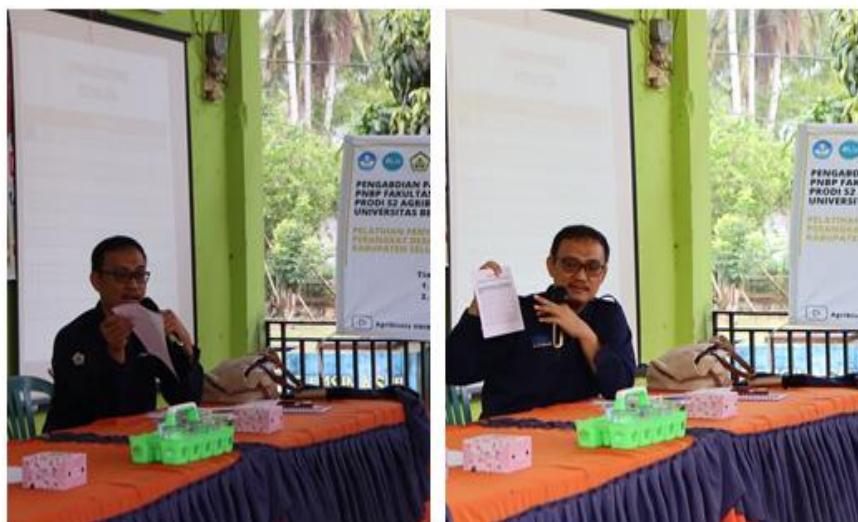
Gambar 1. Materi menyusun faktor eksternal dan faktor internal

Potensi Desa Lokasi Baru yang telah identifikasi dikelompokkan ke dalam faktor internal dan faktor eksternal seperti disajikan pada Tabel 2. Faktor internal mencakup kekuatan dan kelemahan. Indikator kekuatan adalah semua indikator yang mendukung tujuan pembangunan Desa Lokasi baru dan indikator kelemahan adalah semua indikator yang menghambat atau mengganggu tujuan pembangunan Desa Lokasi Baru.