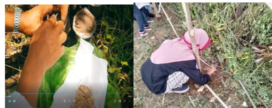
Gambar 6 Penanaman Bibit Labu

Penanaman bibit labu ditanam sekitar 20 bibit labu. Penanaman bibit labu bertujuan untuk memanfaatkan sisa lahan kosong dekat kolam budidaya, mengurangi paparan sinar matahari yang masuk ke dalam kolam budidaya, sebagai produk usaha santri, dan contoh penerapan budidaya pertanian.