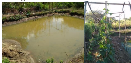
Gambar 9 Kolam Bu LeLa