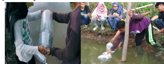
Gambar 7 Penebaran Bibit Lele

Penebaran benih ikan lele dilaksanakan pada hari rabu 01 Mei 2019 jam 16.00. adapun ukuran benih ikan lele yang di tebar yaitu 7 cm padat tebar benih ikan lele yaitu sebanyak 1500. Pemberian pakan dilakukan 3 kali sehari yaitu pagi, sore dan malam hari. Jenis pakan yang digunakan yaitu Hiprovit Pelet 781.