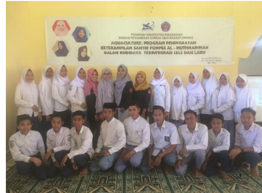
Gambar 3 Kegiatan Penyuluhan