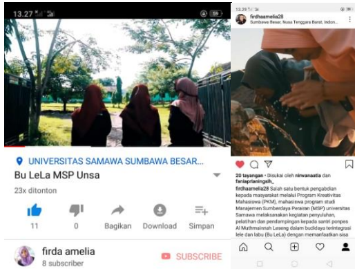
Gambar 10 Video PKM yang di share melalui media online