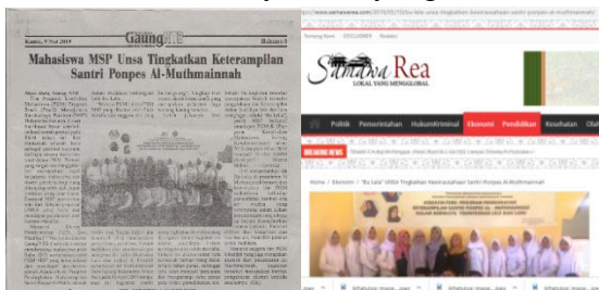
Gambar 11 Publikasi Koran Gaung NTB dan Samawa Rea