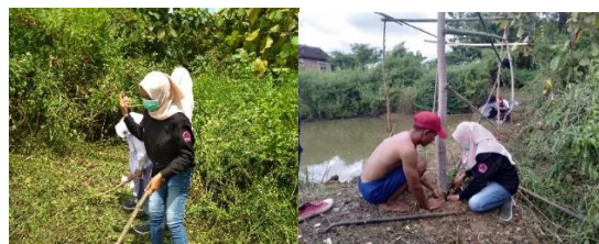
Gambar 5 Kegiatan Pembersihan Kolam dan Pembuatan Para-para

Pembersihan kolam budidaya dan pembuatan para-para labu dilaksanakan hari Selasa 30 April 2019. Pembersihan kolam bertujuan untuk agar kolam terlihat bersih dikarenakan banyak tumbuhan dan kangkung air yang sangat banyak didalam kolam. Luas kolam yang dijadikan kolam budidaya yaitu 24 m 2 . Setelah itu, dilakukan pembuatan para-para labu air yang berada dekat dengan kolam budidaya.