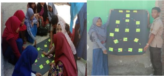
Gambar 8 Penyusunan Struktur Organisasi Bu LeLa

membentuk struktur kepengurusan santri. Struktur kepengurusan terdiri dari ketua dan wakil pengurus, sekretaris, bendahara, divisi pakan, divisi labu dan divisi pemasaran. Hal ini bertujuan untuk membangun tanggung jawab santri ponpes Al-muthmainnah dalam menjaga keberlanjutan kegiatan.