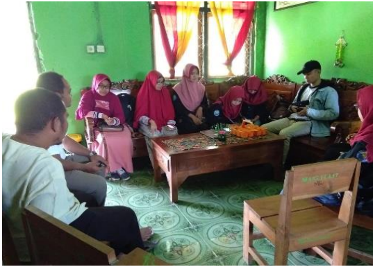
Gambar 2 Sosialisasi Kegiatan